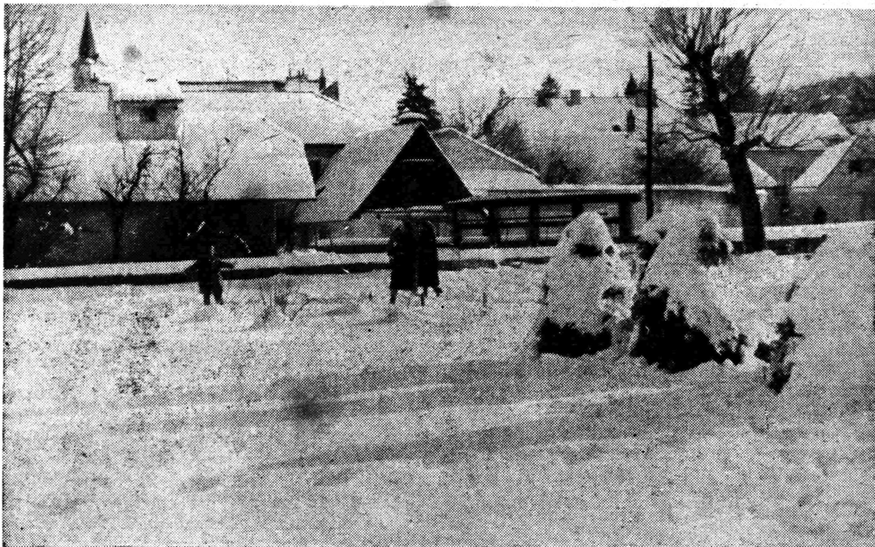
Zimski pejzaž u Samoboru

Glasanje će se vršiti pomoću izbornih listića i to zaokruživanjem rednog broja, koji se nalazi pred imenom kandidata, za kojeg se delegat odlučio. Na svakom izbornom mjestu bit će vidno označen broj