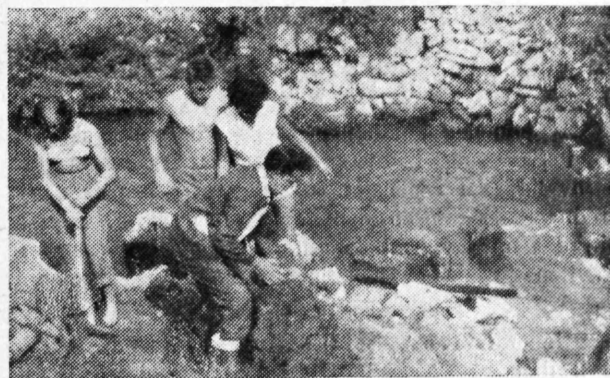
Gradna predstavlja stalnu opasnost za naš grad. Omladina proširuje potok na kritičnim mjestima.

Mirka, Ivica, Joža, Šverovi, Mogutovi, kao i svi drugi, čija su imena utkana u ovu radnu akci-