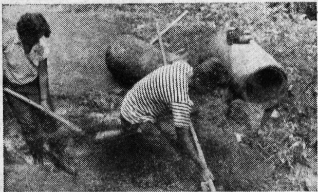
20 dana po 4 sata dnevno. To je obaveza đaka i studenata

Drugog srpnja poslije podne u romantičnom predjelu uz potok Gradnu od Muzejskog parka prema Vugrinščaku započela je omladina Samobora, koja polazi škole u Zagrebu, još jednu bitku. Ovaj puta bitku sa zemljom i vodom.