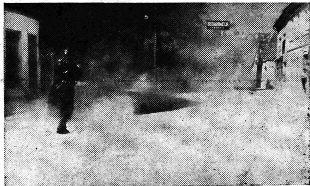
Raščišćavanje zatrovanog prostora pred »Lavicom«

U nedjelju 8. o. mj. su pripadnici Civilne zaštite i vatrogasnih društava Samobora i »Fotokemike« održali javnu vježbu. Fingiran je napad aviona na Samobor, gdje je »neprijatelj« zatrovao prostor kod »Lavice«, »porušio« neke zgrade, izazvao po-