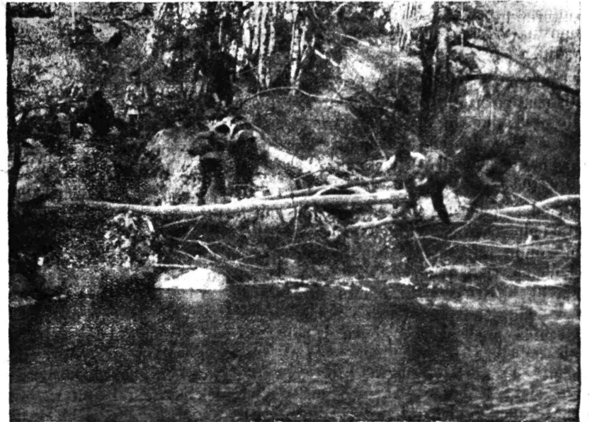
Prijelaz preko Sutjeske