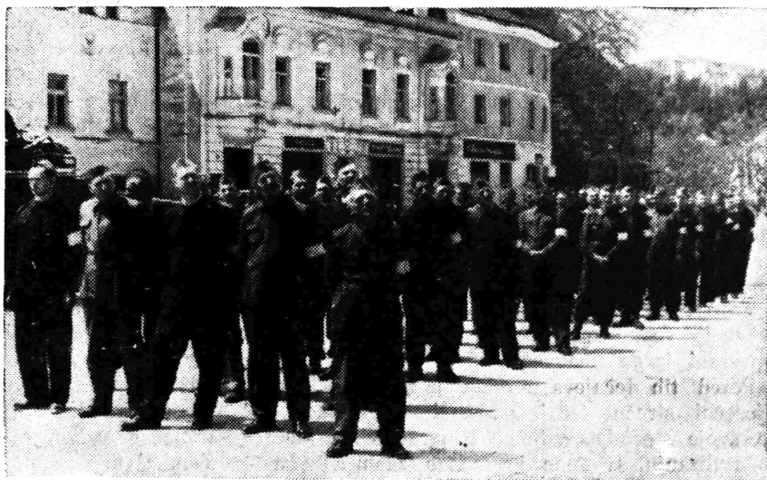
POLAZNICI TEČAJA PROTUVAVIONSKE ZAŠTITE U SAMOBORU POKAZALI SU SVOJE ZNANJE NA VJEŽBI U PROŠLOJ GODINI