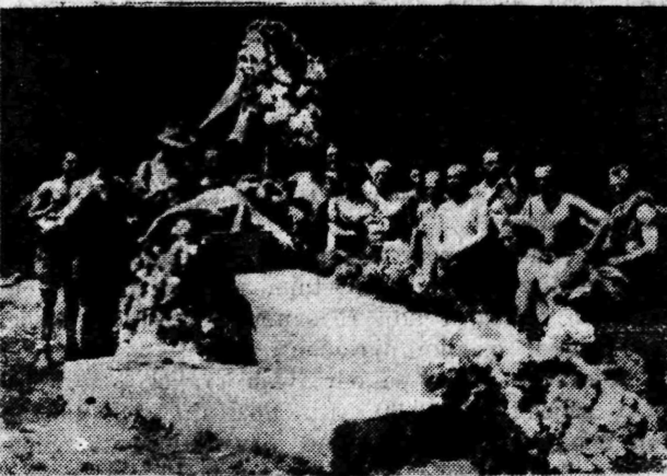
Na grobu Save Kovačevića

Dolazimo na grob legendarnog heroja sa Sutjeske Save Kovačevića. Lica ozbiljna, tišina. Odaćmo počast šutnjom i kliknismo: »Slava palom junaku!« Stezala mi se riječ u grlu, kad sam dru-