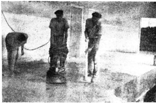
. . . bruse taracirani hodnici . . .