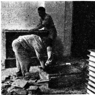
Postavljaju se peći . . .

šten veći broj razreda. Pored tih prostorija, dovršen je i upravni trakt s prostorijom za direktora, tajnika, ambulantu, omladinsku organizaciju, predvojničku obuku i kuhinju. U 5 kabinet-skih prostorija smjestit će se: fizikalni i biološki kabinet, te čitaonica, crtaona i radionica. Zatim je dovršeno daljnjih 9 priručnih prostorija za smještaj instrumenata za pojedine kabinete. Izvode se još samo neki manji obrtnički radovi (parketarski) i odmah poslije dovršenja dovest će se već nabavljeni moderni namještaj tako, da će se rad u novoj školskoj 1957.-58. odvijati po savremenim metodama. S drugim krilom zgrade čiji su temelji već betonirani započelo bi se u toku naredne godine ukoliko se osiguraju za to potrebna financijska sredstva. Dovođenjem i tog dijela zgrade riješilo bi se bar za dogledno vrijeme pitanje školskog prostora u Samoboru. M.