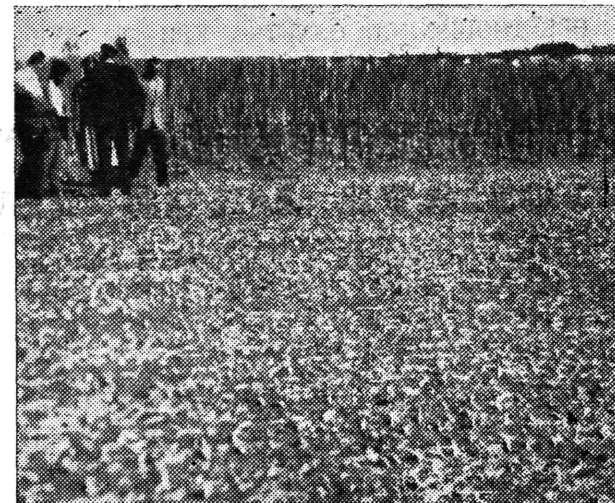
Ekonomija u Celinama. Ovdje je bilo jutro i pol zemljišta zasadeni lukom, a sada . . . trulež oštećenog luka osjeća se nadalje.

Ljudi tih sela su očajni tim više, što nisu osigurani za slučaj elementarnih nepogoda. Ekonomija Poljoprivredne zadruge Samobor u Celinama spremila se na berbu rajčica, paprike i luka i ta površina od 5 jutara, kao da je zbrisana a ostao je po koji kolac od rajčica, a sve ostalo je smlavljeno i zabito u zemlju. Spomenuta sela stradala su za cijelih 100 posto, dok su sela: Farkaševac, Strmec, Orešje i bliža okolica stradala od 20 do 80 posto. Na nekim mjestima led je dosizao visinu i od pola metra. Postradali seljaci uz pomoć NO-a općine i stručnjaka ubrzano rade na preoravanju i zasijavanju nekih kultura. Dobar dio, zapravo veći dio je već zasijan i to: heljdom, djetelinom, korabom, inkar-