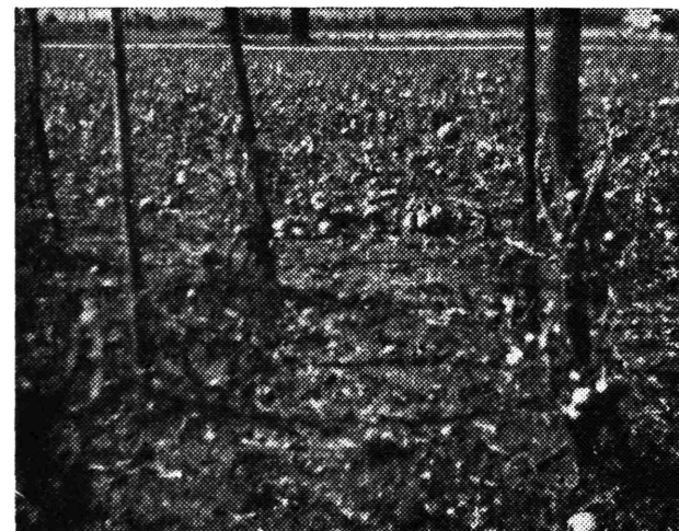
Ni kilograma paradajza nije ostalo od 4 kg. zasadenih . . . isto i od 2 kg. paprike — na ekonomiji Poljoprivredne zadruge Samobor u Celinama. Za razliku od ostalih poljoprivrednika zadruga je osigurala usjeve od elementarnih nepogoda kod DOZ-a, koji će podmiriti štetu sa 100 %.

Njive, na kojima su se lelujale već po negdje isklaskale stabljike kukuruza nestale su, da ih poslije tuče zamijeni očajno pusta i prazna ledina s po kojim patrljkom, koji ne odsječen viri iz zemlje. Najteže su postradala sela oko Save, i bez svega su ostala sela: Gradna, Celine, Vrbovec, Medsave i druga, tako, da su pored uništenih polja, kuće