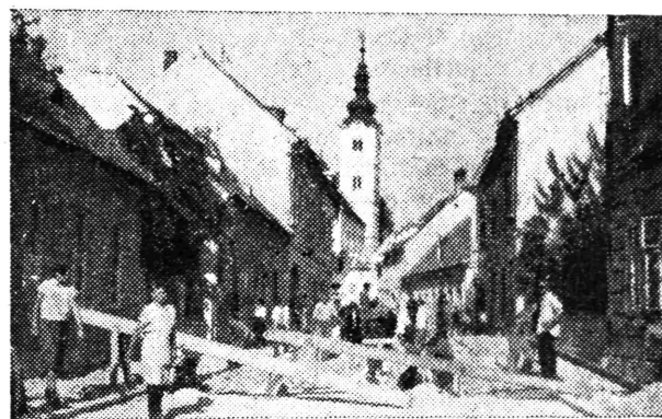
Radovi na kockanju Perkovčeve ulice