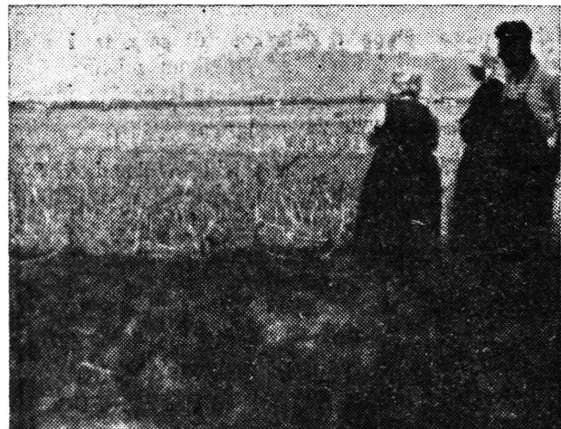
Tu je nedavno bilo polje kukuruza . . . a sada bez riječi, nijemi, promatraju mještani u Celinama, tučom i vjetrovom opustošena polja.

Tuču, kakova se sručila 15. VII. na okolicu Samobora, ne pamte ni najstariji ljudi. Nešto iza 14 sati nadviše se gusti crni oblaci iznad Samobora, koji su nošeni vjetrovom u pravcu Save, dali naslutiti zlo, koje se u njima krije. Uz kišu i vjetar počela je padati tuča u veličini većeg oraha i u ne-