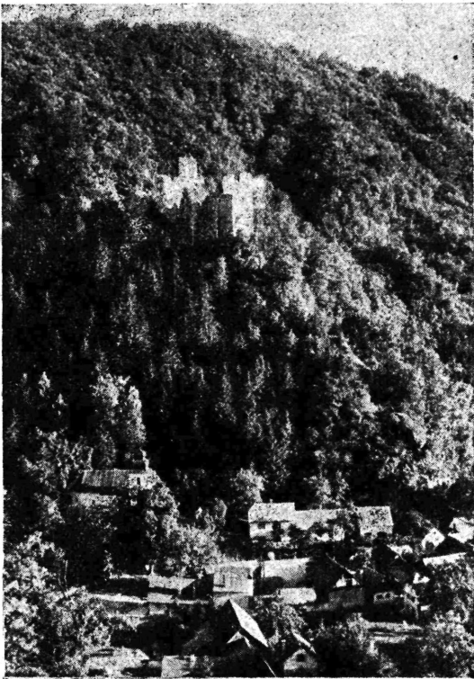
Pogled na Taborec sa Starim gradom

Dramska sekcija spremi i drugi komad i uskoro — bude li publika dala svoju podršku našim amaterima — otpast će potreba, da vučemo iz Zagreba lošije ansamble za skupe novce. Kod ove prve izvedbe posjet nije bio baš najbolji, a još slabiji kod reprize, ali se s pravom vjeruje, da će iduće priredbe dobiti svoju zasluženu moralnu podršku, a time i sve drugo. B. Mažuran