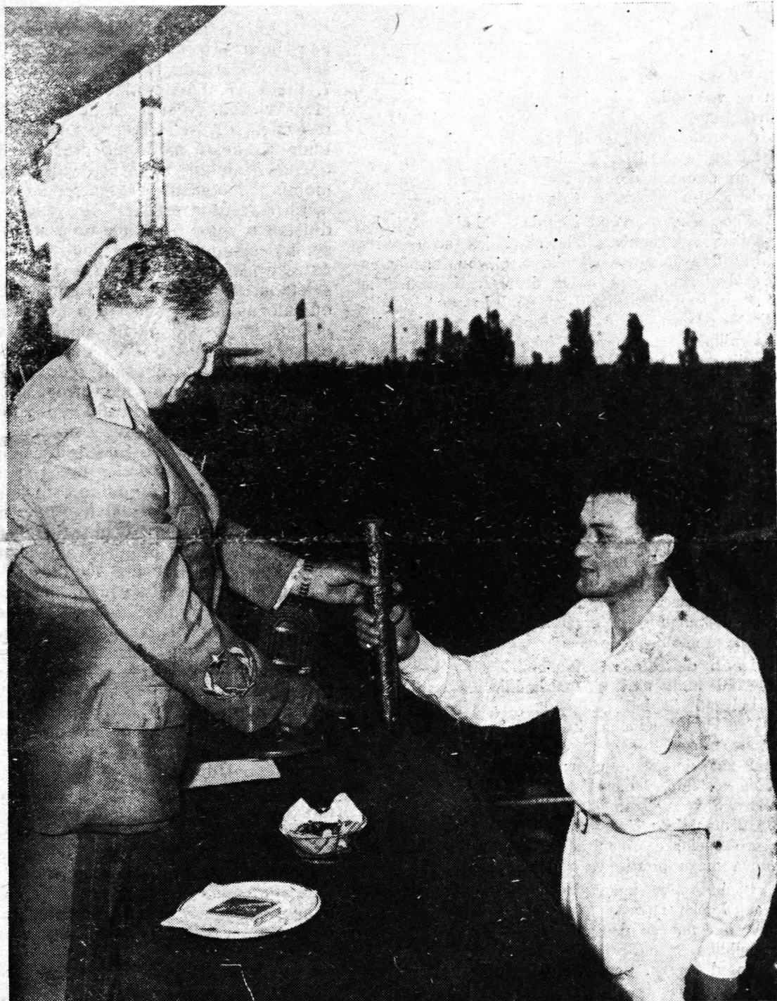
Pređaja šlafetne palice Maršalu Titu sa pozdravima naroda Jugoslavije

Svaku točku izvedenog programa prisutni su nagradili burnim pljeskom. — Tako je i taj neslužbeni praznik naših naroda, 65-ti rođendan Predsjednika Tita, proslavljen u Samoboru najsvečanije. M