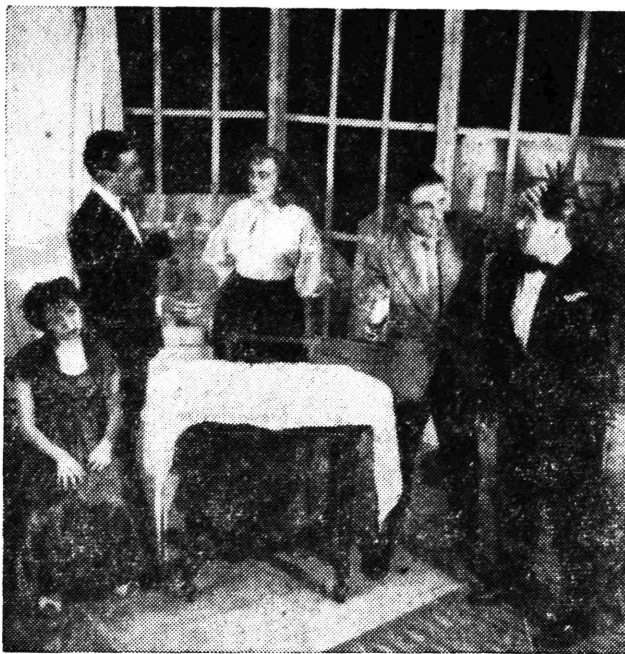
Scena iz komedije »Uzoran muž« koju izvode članovi KUD-a »I. G. Kovačić« iz Samobora

Da bi ova jubilarna skupština u potpunosti uspjela, molimo ovime, sve članove i prijatelje našega društva, da svojim prisustvom uveličaju ovu jubilarnu skupštinu. Odbor