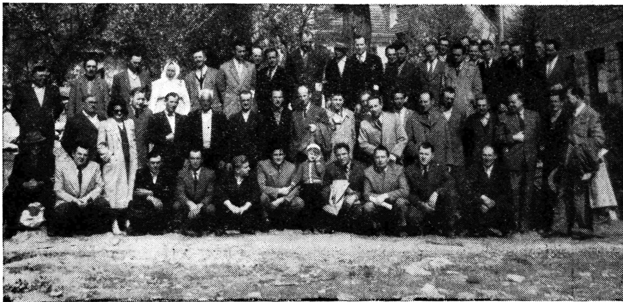
Odbornici Općinskog vijeća i Vijeća proizvođača na gradilištu nove škole u Samoboru.