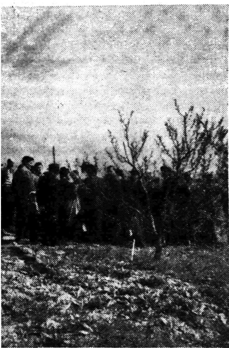
Radnici zavoda za voćarstvo u Bistracu pripremaju se za sjetvu. Na slici se vide radnici u polju, a u pozadini se vide stabla i zgrade. Ovo je dio priprema za sjetvu hibridnog kukuruza u općini Samobor.

Ovih dana rade komisije radničkih savjeta, Op- ćinskog sindikalnog vijeća i Narodnog odbora opći- ne na donošenju novih tarifnih pravilnika. Do dan- as je potpisano 60% tarifnih pravilnika, a do 20. o. mj. će vjerojatno biti potpisani svi tarifni pravil- nici. — Iako često ima različitih gledanja na poje- dine probleme, ipak do sada nije bilo problema, ko- ji se nebi mogao riješiti.