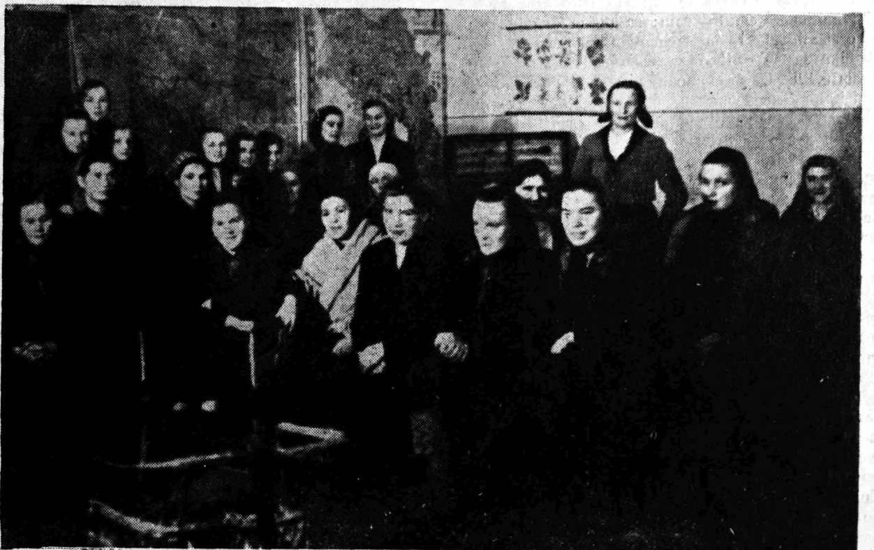
Na predavanju »Kluba naprednih zadrugara« (sekcije žena) u Narodnoj školi Strmec uz diaprojektor

Za dan 7. III. o. g. uoči »Dana žena« — SSRN grada Samobora organizira svečanu akademiju. Akademija se održava u Narodnom domu u 6 sati poslije podne, a u programu sudjeluje limena glazba, pjevački zbor KUD »Ivan Goran Kovačić«, folklorna grupa Đačkog doma — uz referat i recitacije. Svečane proslave spremaju se i u Bregani, Sv. Nedjelji i Molvicama.