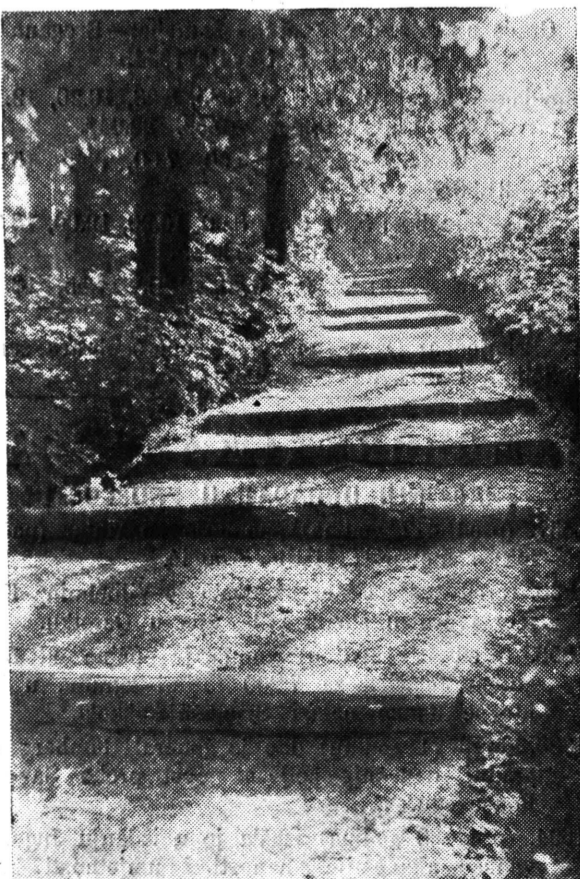
NOVO POSTAVLJENE STEPENICE U ANINDOLSKOM PERIVOJU

Uporedbom cijene koštanja jedne tone lignita »Velenje« sa dva prostorna metra ogrevnog drveta razreda A, pokazuje se ušteda od oko 3.000 dinara.