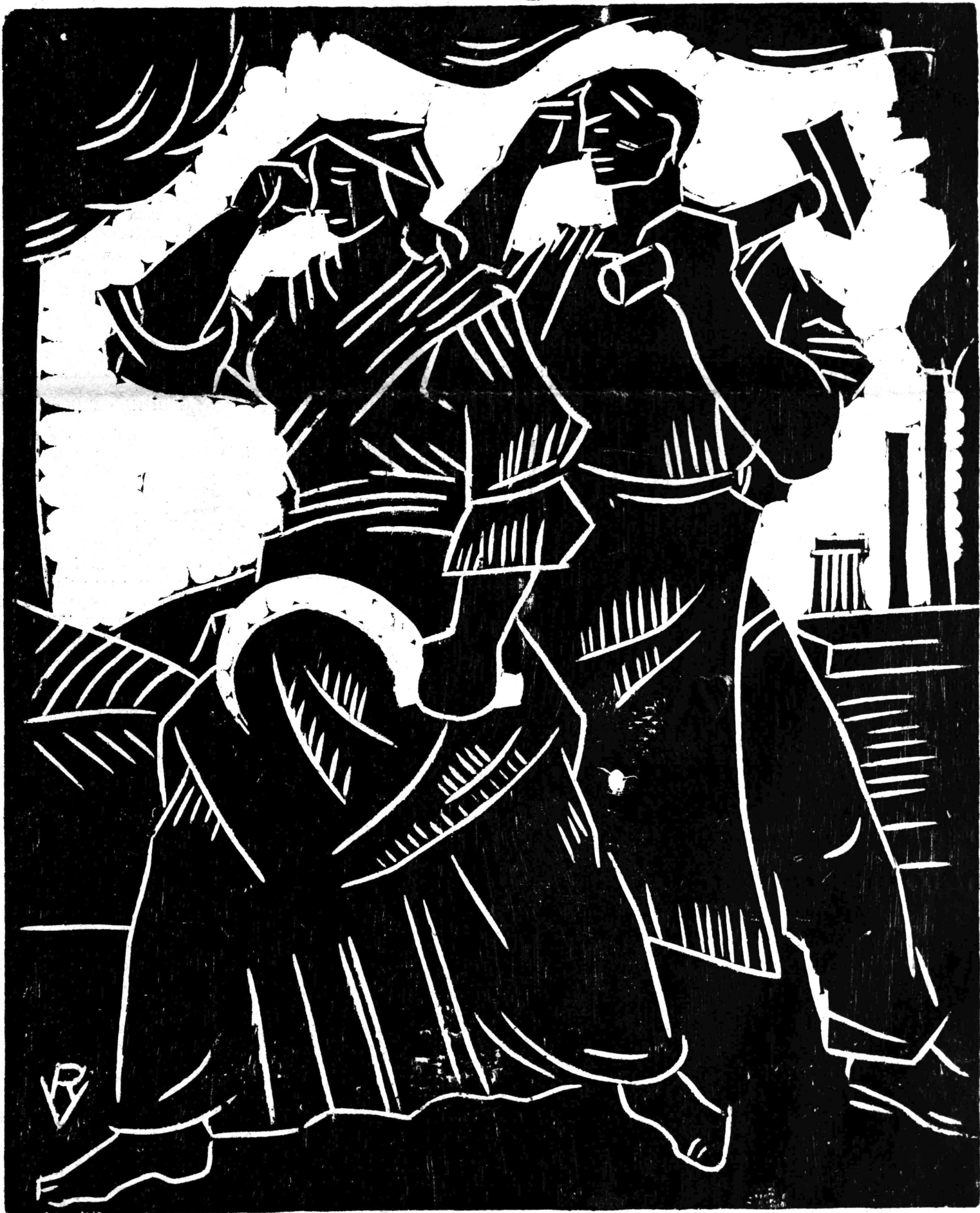
Originalni drvorez Vanje Radauša sa naslovne stranice partizanskog časopisa »Rodoljub« izdavanog u NOB-i u Zumberku, 1943.