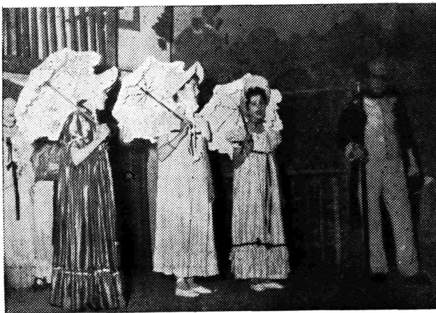
»Tri djevojčice dolaze na svečanost«