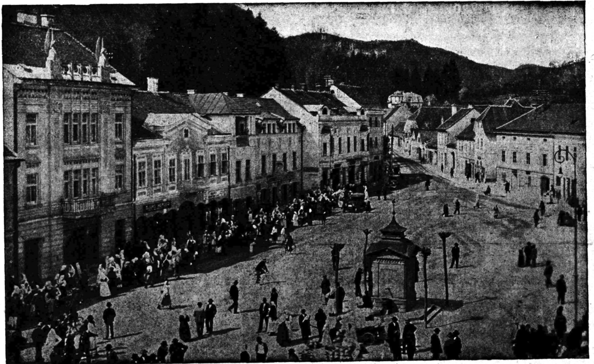
SAMOBORSKI TRG SA KUĆOM BROJ 20. U KOJOJ JE STANOVAO A. G. MATOŠ