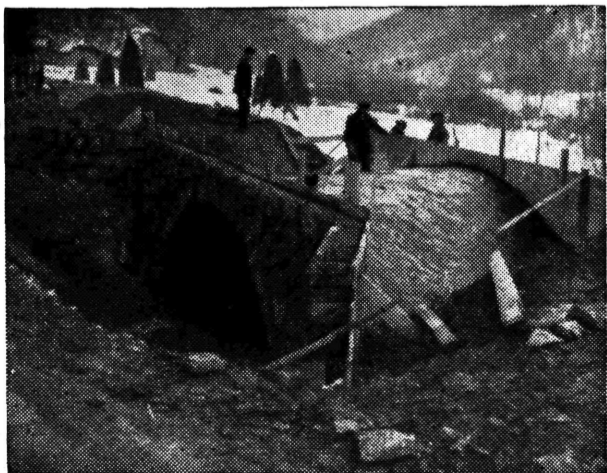
Izgrađen most u Smerovišću

Da nije bilo toga doprinosa stanovništva, mnoge od tih potreba ne bi se mogle riješiti, jer sredstava za tako velike potrebe nema.