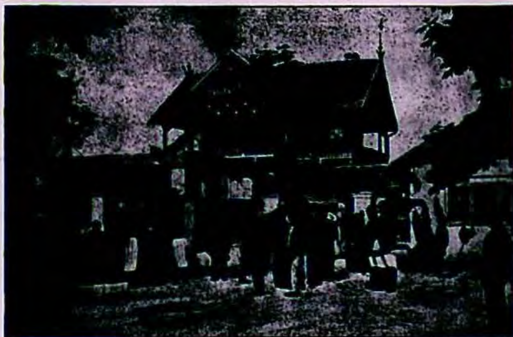
Gostionica „Kraljici Prirode“ E. Presečki-a.

Objed se može i posebice naručiti, da se naznači broj gostiju i vrsta jestiva, te da to domaći najave usmeno, a strani pismeno u Šmidhenovoj ulici broj 4.